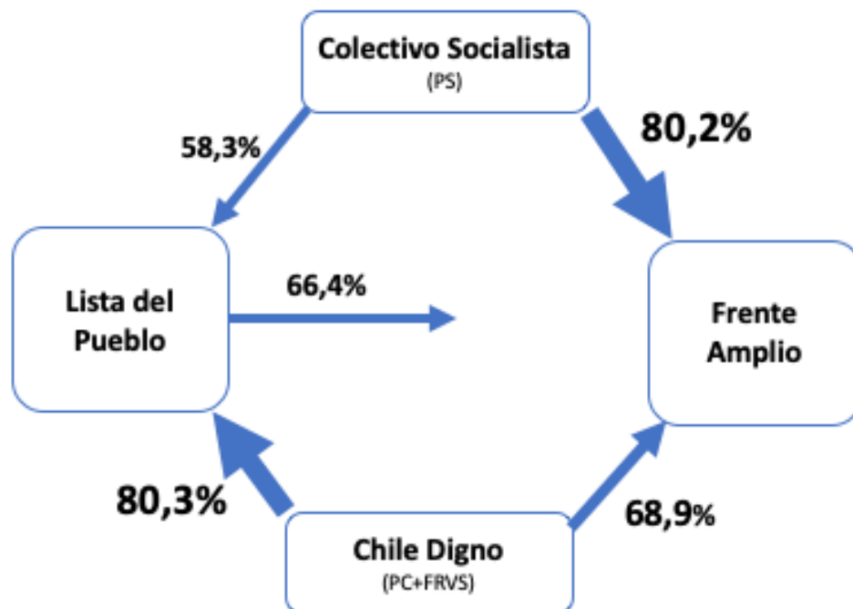
Figura 1. Grado de coincidencia en votaciones de colectivos de izquierda.

En el caso de la Lista del Pueblo, se observa una fuerte afinidad con el Movimiento Social Constituyente (MSC) (que reúne a 13 constituyentes independientes de diversos movimientos sociales), y con los y las representantes de pueblos originarios. Los y las convencionales del MSC han votado en un 90,3% como promedio en forma idéntica que la mayoría de la Lista del Pueblo, el 80,9% de los y las representantes de los pueblos originarios y, como ya dijimos, 80,3% en el caso de Chile Digno (Figura 2).